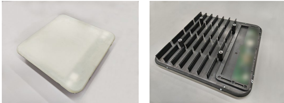
図 2 開発した NTN 向け平面アンテナ(約 45cm 四方)

さらに、今回開発した NTN 向け平面アンテナをモデム等と統合し、衛星通信ユーザー端末としての動作も確認できました。より軽量で、そのまま搭載・動作が可能な端末を実現したことで、ドローンや車両など、搭載可能なモビリティの範囲を大きく広げました。