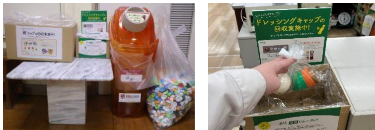
（左）大野中学校における回収の様子（右）カスミ鹿嶋スタジアム店における回収の様子

https://city.kashima.ibaraki.jp/site/kashimaphoto/89296.html